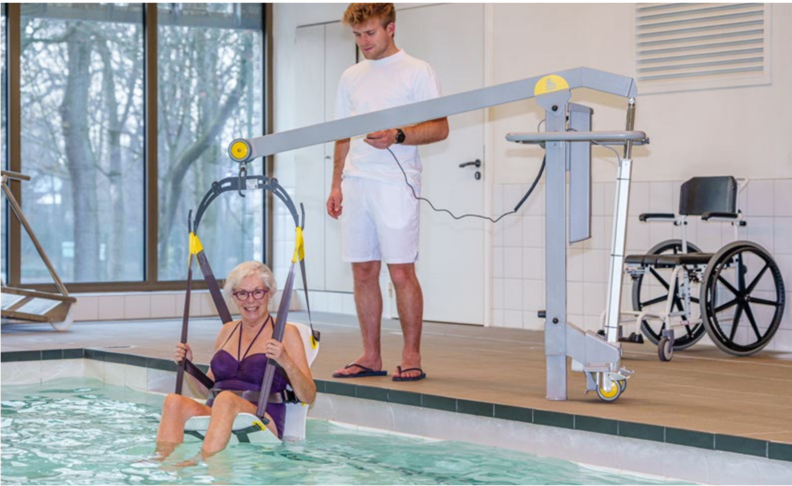
∨ Schwimmbadlifter mit Badesitz